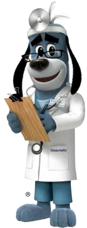
Dr. Health E. Hound® 是 UnitedHealth Group 的註冊商標。