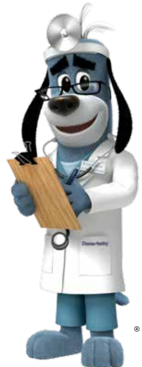
El Dr. Health E. Hound® es una marca comercial registrada de UnitedHealth Group.

No espere hasta el último momento. Si ya le toca un chequeo a su hijo, llame hoy para hacer una cita. No espere hasta el verano, cuando los consultorios de los pediatras están muy ocupados. Lleve a la cita todos los formularios escolares, deportivos o de campamento que necesite.